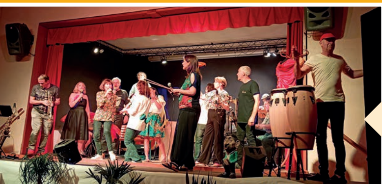
Spectacle musical avec la troupe du Cabaret de l'aventure