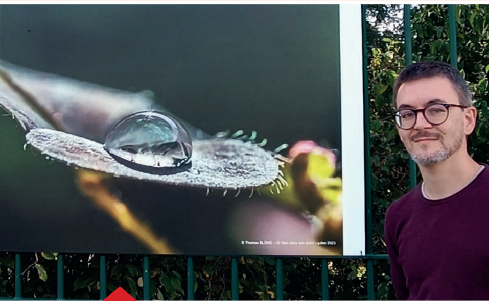
La goutte d'eau