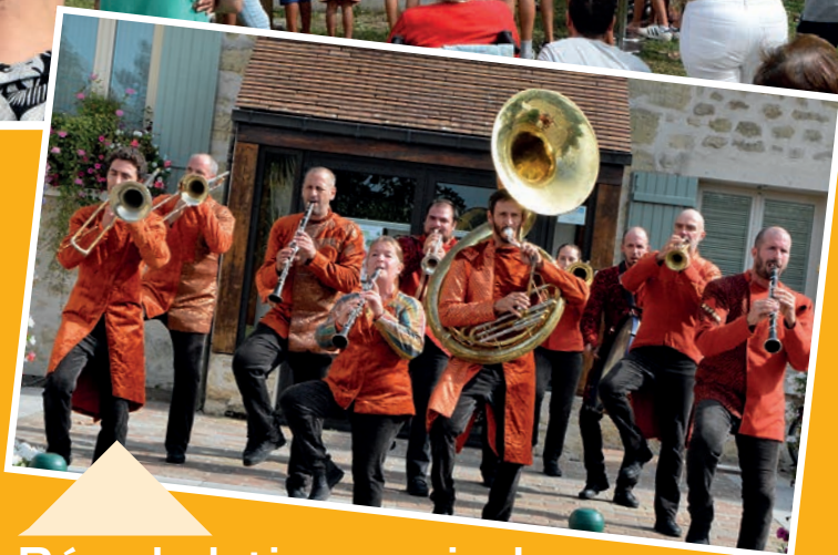
Déambulation musicale par la fanfare "La belle image"