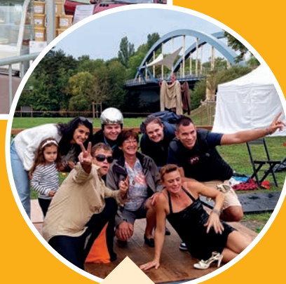
spectacle compagnie "Si j'y suis"