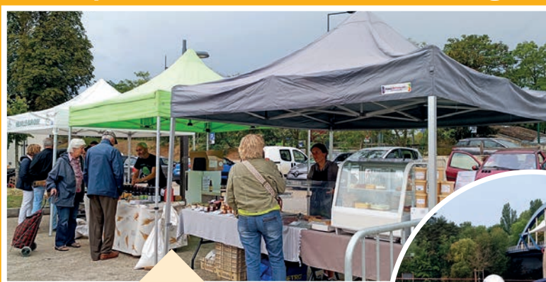
Marché du terroir